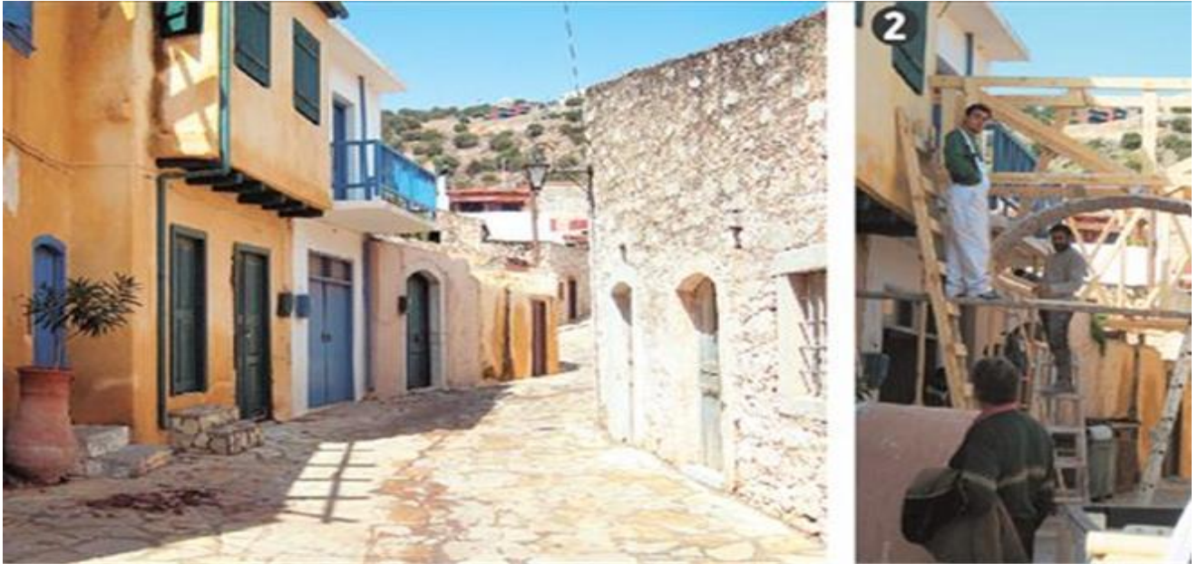
Το ισόγειο στον κεντρικό δρόμο της Επάνω Ελούντας (φωτογραφία αριστερά ) όπως μεταμορφώθηκε σε καφενείο της τηλεοπτικής Σπιναλόγκας από τον Αντώνη Χαλιιά για τις ανάγκες της σειράς του Mega «Το Νησί» ( δεξιά ). Ο σκηνογράφος Αντώνης Χαλιιάς και οι συνεργάτες του έφτιαξαν από την αρχή όλα τα σκηνικά, ώστε να θυμίζουν την περίοδο από το 1939 έως το 1957.