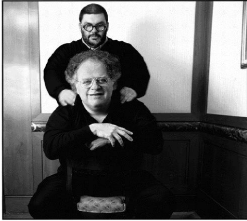
Με τον μάεστρο Τζέιμς Λιβάιν -10/11/2002

- Αν είχατε τη δυνατότητα να στήσετε μια φανταστική ομάδα, ποιοι μύθοι του ποδοσφαίρου σήμερα θα την αποτελούσαν;