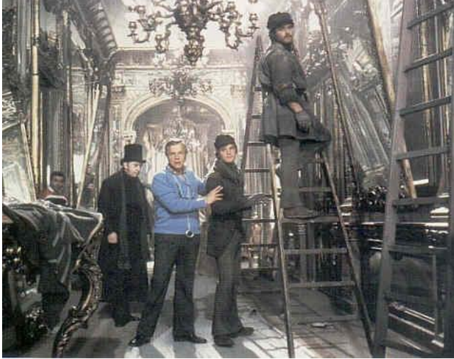
Στο σκηνικό της Traviata