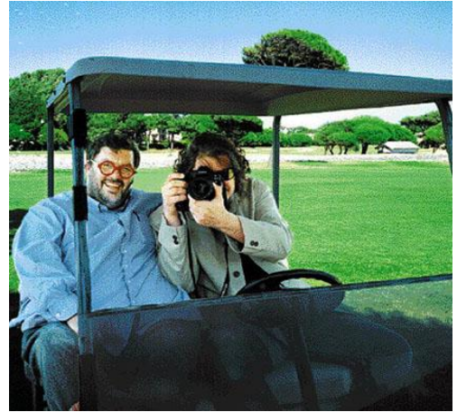
Με τον τενόρο Χοσέ Κούρα - 11/7/2004

- Είπατε κάποτε, όταν σας συνέβησαν όλα αυτά με τα ναρκωτικά: «Ήμουν το νούμερο 1 κι έγινα το νούμερο 10.000». Τι σημαίνει αυτό για έναν άνθρωπο;