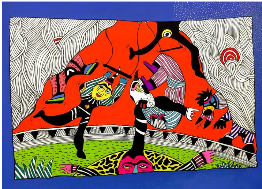
Κοινή έκθεσή του στην Context Art Miami 2016 με τον Οσκαρικό ηθοποιό & εικαστικό Adrien Brody («Ο πιανίστας»).