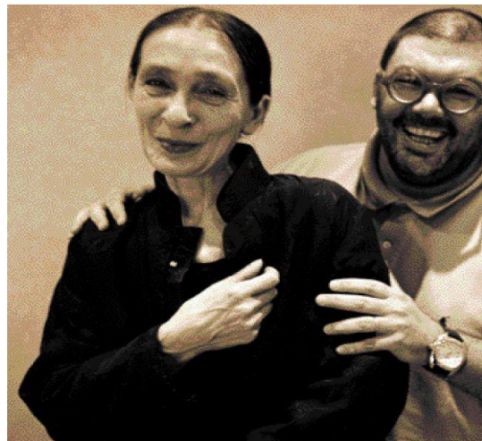
Με τη χορογράφο Πίνα Μπαούς - 8/7/2001

Άρθουρ Μίλερ στον Θανάση Λάλα - 16/4/2000