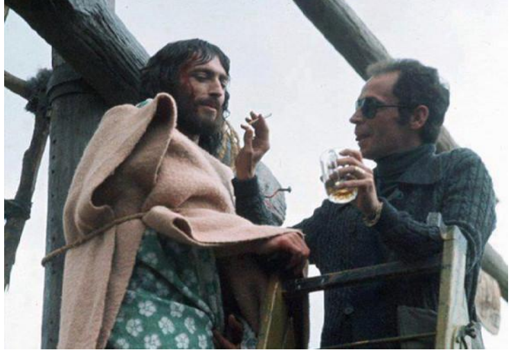
Με τον Robert Powell στα γυρίσματα «Ο Ιησούς από τη Ναζαρέτ», 1974