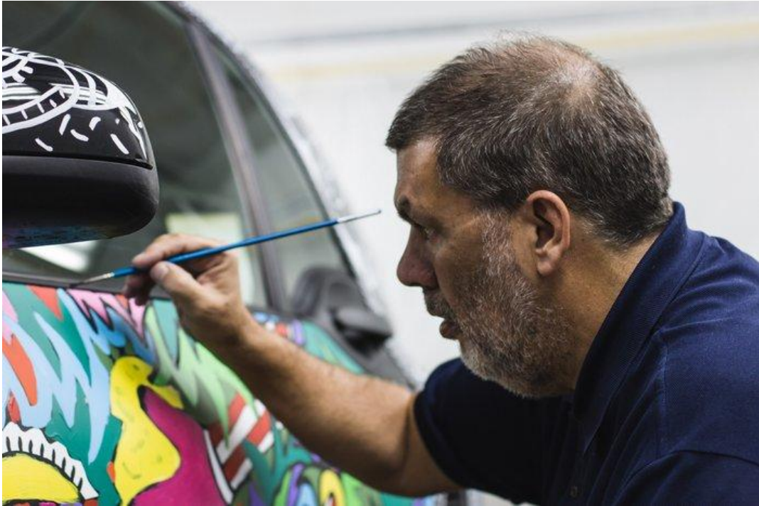
Μετατρέποντας χρηστικά σε έργα τέχνης: Επιζωγραφίζει pop art σε mini αυτοκίνητο Εικαστικός Κύκλος Sianti - 13 Οκτωβρίου 2017